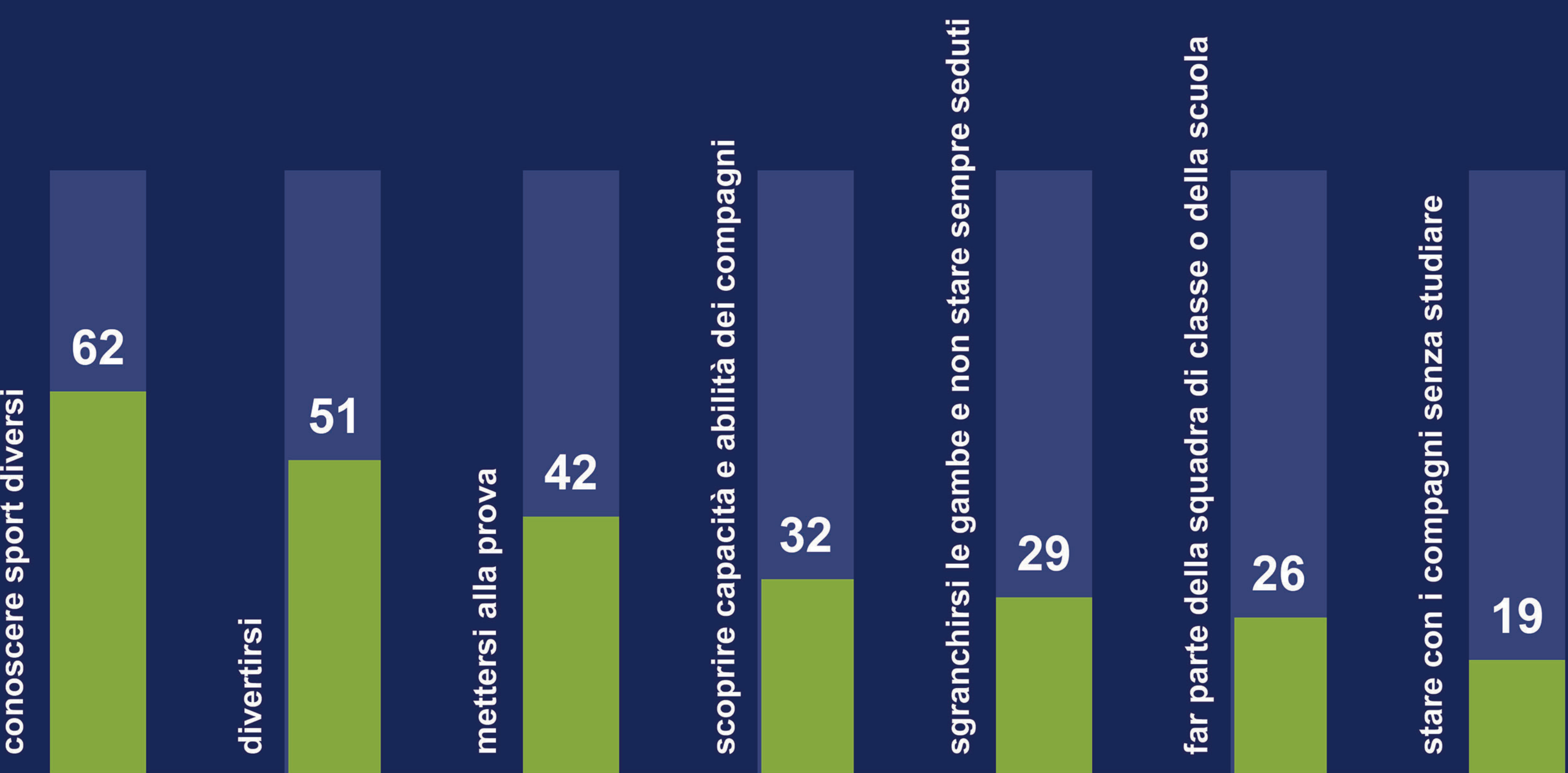
L'ORA DI SCIENZE MOTORIE SERVE A.....

Lo sport a scuola è percepito soprattutto come opportunità per imparare sport diversi, oltre che per divertirsi e mettersi alla prova.